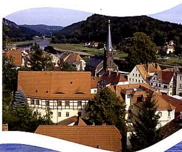
Blick auf die Stadt

Zahlreiche Elbhochwasser haben in Stadt Wehlen schwere Zerstörungen angerichtet, so z.B. 1501, 1655, 1784, 1845, 1890, 1940, 2002 und 2006. Die Wasserstandsmarkierungen am Rathaus lassen das erahnen.